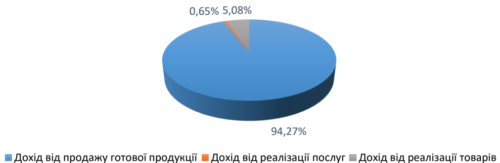
Структура доходів від основної діяльності за типом надходження, %

За структурою доходів від переробки сільськогосподарських культур дохід розподіляється наступним чином: